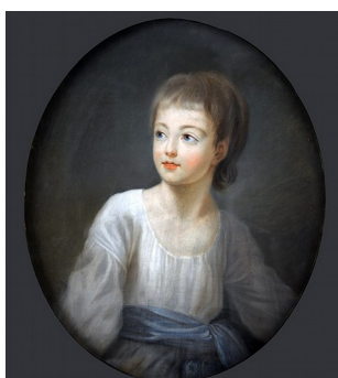
Portrait d'Alfred d'Orsay enfant (1801-1852)