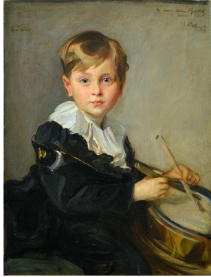
Portrait d'Antoine XIII de Gramont dit L'enfant au tambour , "Paris 1911"

Autorisation de reproduction uniquement dans le cadre d'articles faisant le compte-rendu ou la promotion de l'exposition