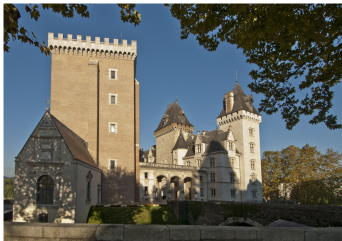
Vue de l'aile est du château de Pau

Situé au cœur du grand sud-ouest, entre Bordeaux et Toulouse, à proximité de l'Espagne, ce palais successivement seigneurial, royal, impérial, est aujourd'hui un musée national qui accueille chaque année plus de 100 000 visiteurs. Sa longue et riche histoire peut encore se lire dans son étonnante architecture, où se mêlent éléments médiévaux, Renaissance et romantiques. De ce passé stratifié, le château a conservé ses trois ailes assemblées en triangle autour d'une majestueuse cour d'honneur ainsi qu'un domaine de plus de 22 hectares de jardins et de parc forestier, vestige du magnifique ensemble constitué par les Albret au XVI e siècle.