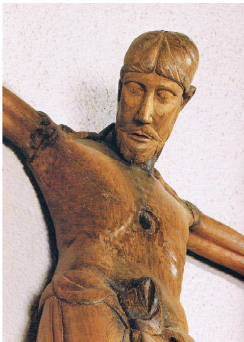
Christ en croix - Musée de Jaca

Puis en cette année de commémoration de la disparition, il y a quatre cents ans, d'Henri IV, il est intéressant de visiter la citadelle de Jaca, oeuvre militaire érigée à la fin du XVI e siècle par Philippe II. Dans son esprit la citadelle de Jaca constituait le point fort d'un ensemble de défense de la frontière aragonaise. Elle protégerait l'Aragon et l'Espagne contre une invasion française.