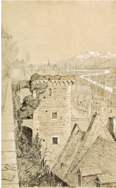
Henry de Triqueti 1803 - 1874